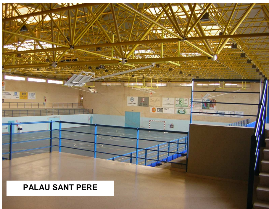
PALAU SANT PERE

ÀREA ESPORTIVA AJUNTAMENT DE BENISSA Palau Sant Pere – Pda. La Costa ,s/n. Tel.965733392 Fax. 965733296 esports@ayto- benissa.es Benissa 03720 ALACANT